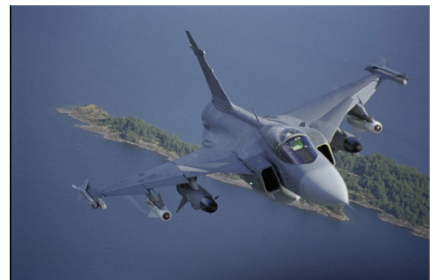
Saab Gripen NG